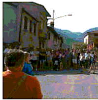
L'assemblea Stefana a Nave

Nuovo integrativo alla Ori Martin spa in città. L'ipotesi di accordo, siglata dall'azienda con le Rsu e la Fiom di Brescia, è stata approvata dall'85% dei lavoratori votanti (287 dei 396 gli aventi diritto). Definite dalle parti i provvedimenti sulla parte normativa quali servizi mensa, aggiornamento del mansionario aziendale, fermate collettive, impianti audiovisivi, ambiente di lavoro.